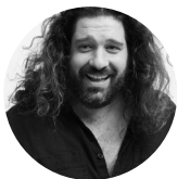
PAVEL HEJNÝ Fotograf / vizuální a grafický poradce