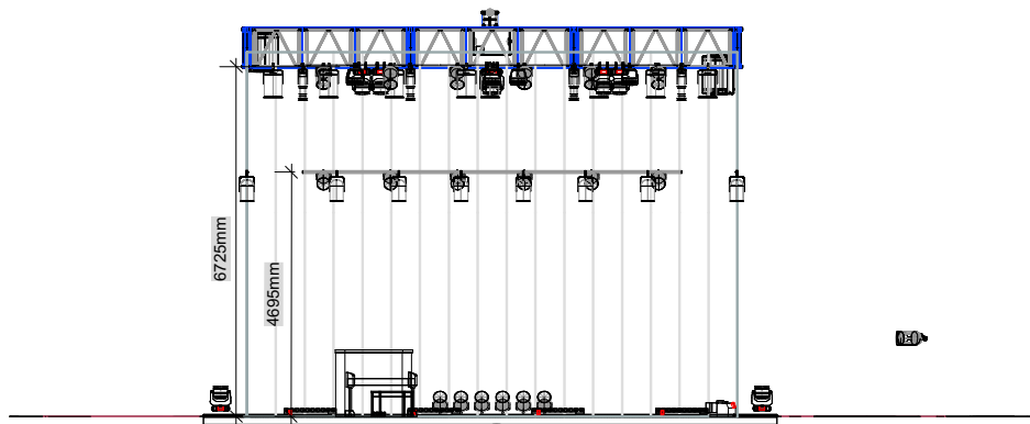
2 Front view Scale: 1:100